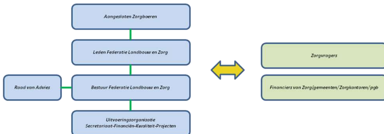
Organogram Federatie Landbouw en Zorg